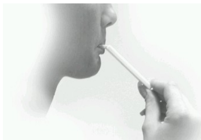
Obrázok: Odber vzorky slín

Pokračujte časťou → Interpretácia výsledkov